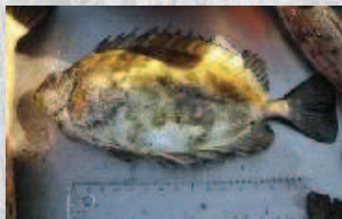
Poissons lapin noir & lapin blanc